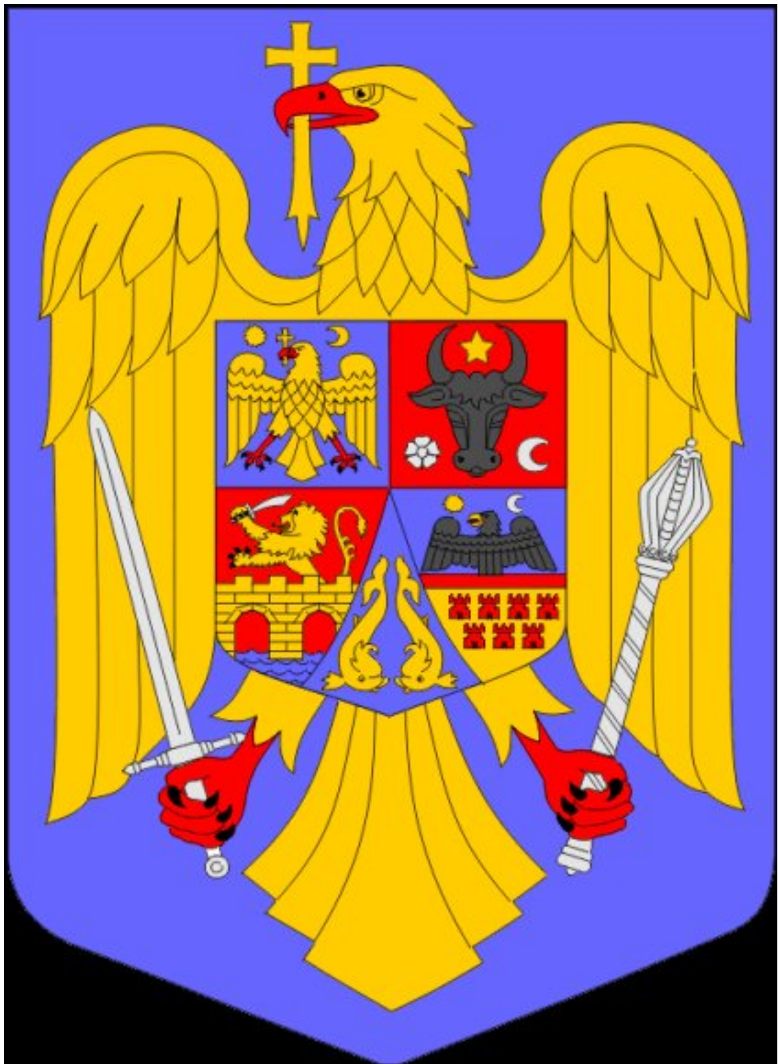
Modelul original al Stemei României în culori,