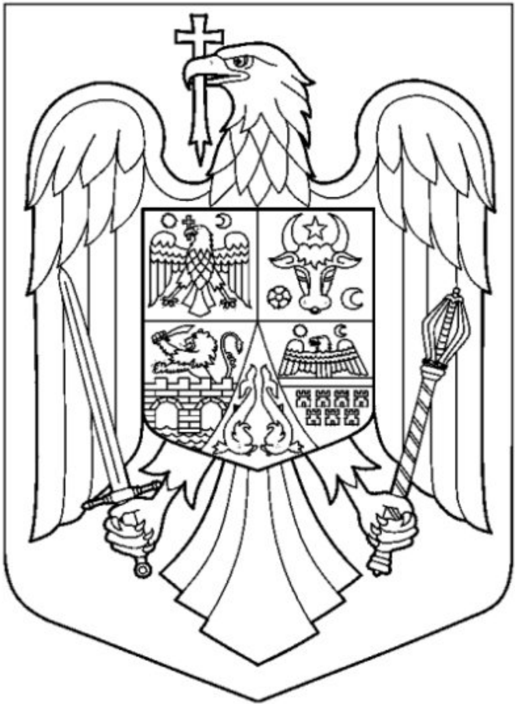
Redarea prin conturare